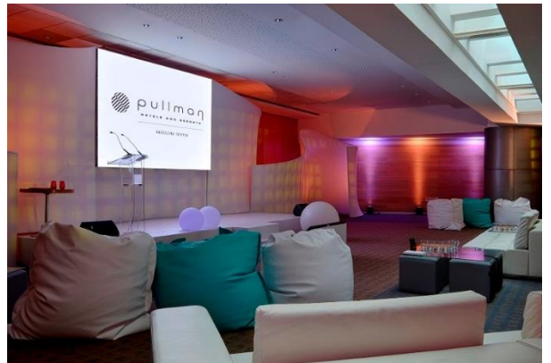
1. CHAMBRE JUNIOR SUITE 2. TAPAS BAR & RESTAURANT 3. SALLE DE RÉUNION